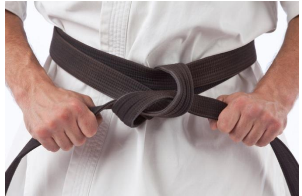
Ihr virtueller Six Sigma Experte (MBB)